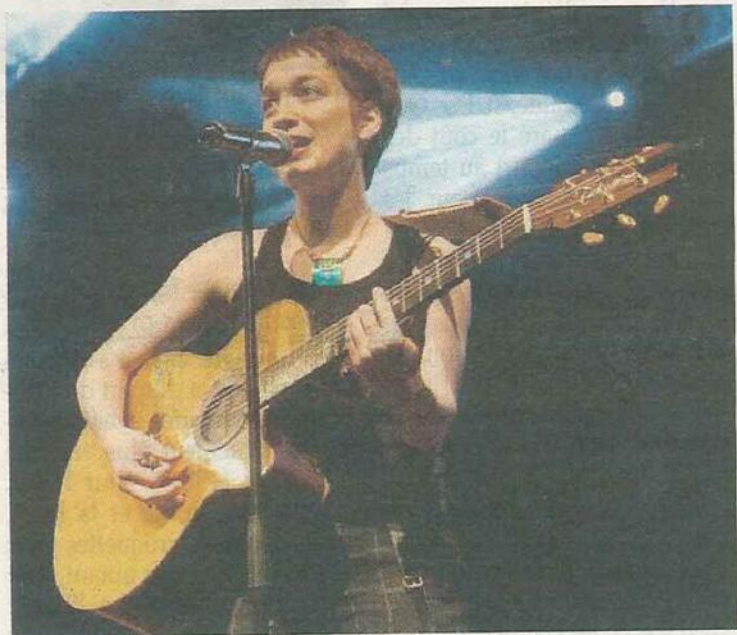
La chanteuse Sand a sorti son deuxième album cette année. Elle y dresse différents portraits de femme.

L'année 2011 aura également été marquée par la sortie du second album de la gessienne Sand en octobre, Sirocco . Son premier disque avait rencontré un succès et plus de 120 concerts en avaient découlé. Chansons veloutées et électriques, Sand n'hésite pas à explorer, avec ses musiciens et complices, des ambiances reggae, rock, hip-hop, ou sur fond de jazz. Ce nouvel album est dédié aux femmes avec divers portraits de la gent féminine. Elle sera en concert à Annecy ce vendredi 30 décembre.